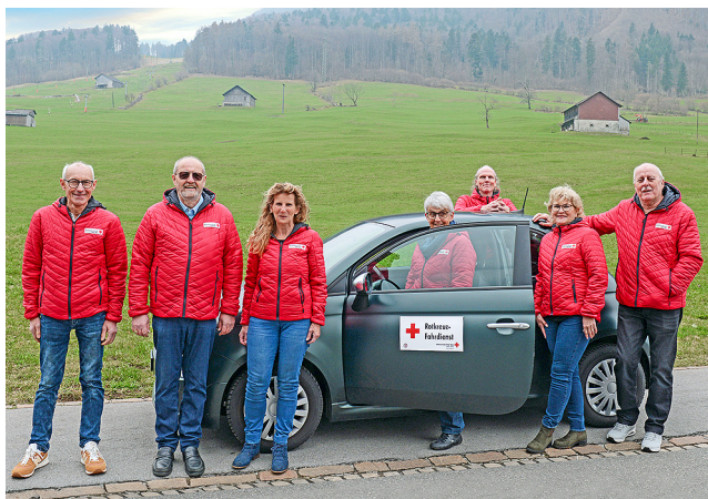
Freiwillige für das SRK Kanton Glarus unterwegs.

Sie bestellte den Fahrdienst auf 13.45 Uhr, um den Termin im Kantonsspital Glarus für eine Kontrolle ihres Herzschrittmachers wahrzunehmen. Als unser Fahrer am Wohnort des Fahrgastes ankam, fand er sie in aller Ruhe beim Lesen eines