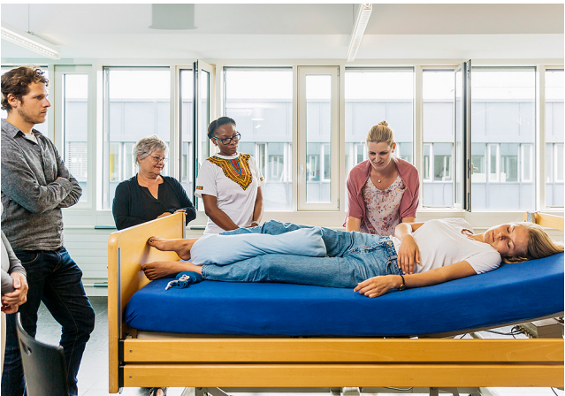
Lehrgang Pflegehelfende SRK.

Obschon nicht alle unsere Weiterbildungen und Kurse im Jahr 2023 durchgeführt werden konnten, dürfen wir bei unseren Bildungsangeboten einen Anstieg verzeichnen. Mit unseren Angeboten im Bereich «Wohlbefinden und Gesundheit» haben wir zusätzliche Anreize geschaffen, welche interessiert wahrgenommen wurden. Dieses vielfältige Angebot haben wir auch in unserem Bildungsangebot für 2024 ergänzt und erweitert.